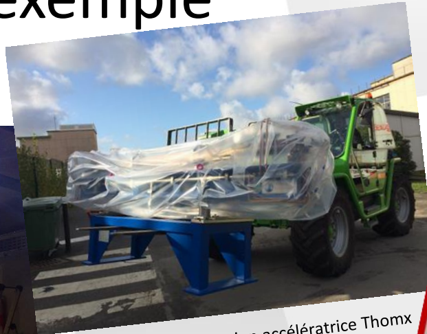
Transfert de la section accélératrice Thomx