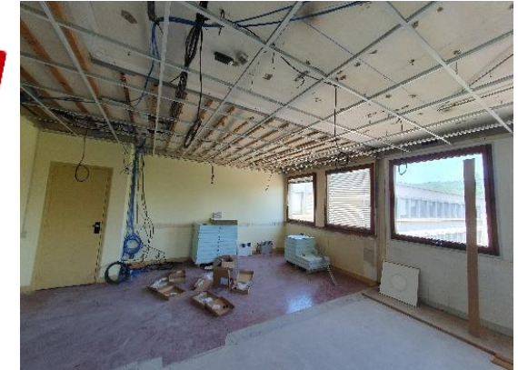
Chantier rénovation tertiaire B100, Future installation du pôle théorie