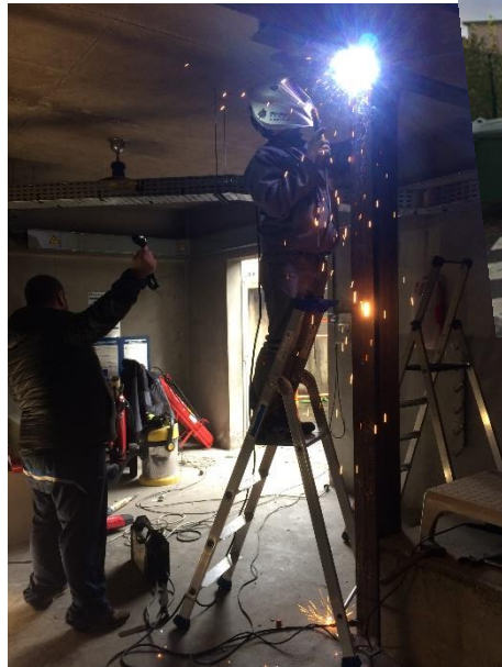
Mise en place d'une poutre de renfort (poste HT bat208)