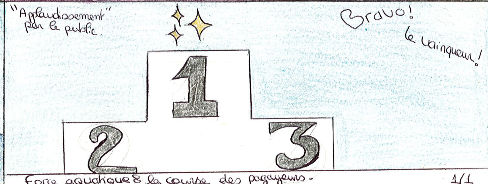
Force aquatique & la course des pagayeurs.