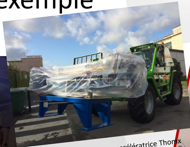
Transfert de la section accélératrice Thomx