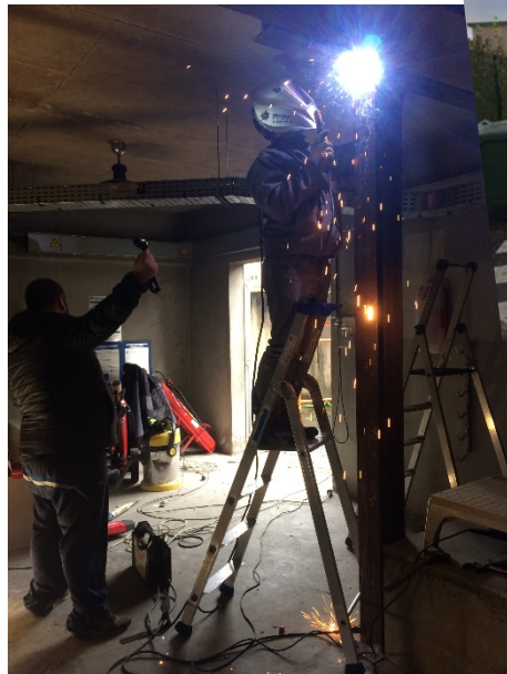
Mise en place d'une poutre de renfort (poste HT bat208)