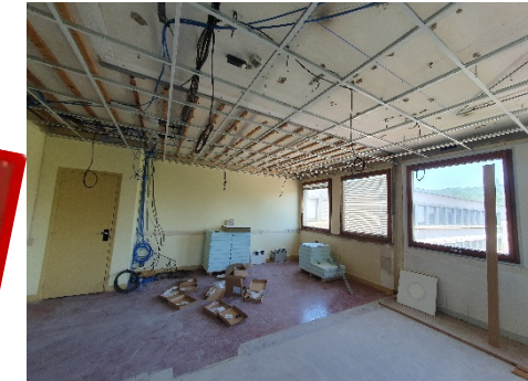
Chantier rénovation tertiaire B100, Future installation du pôle théorie