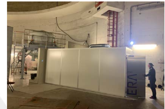
Raccordement électrique de la salle laser de PERLE dans l'Igloo