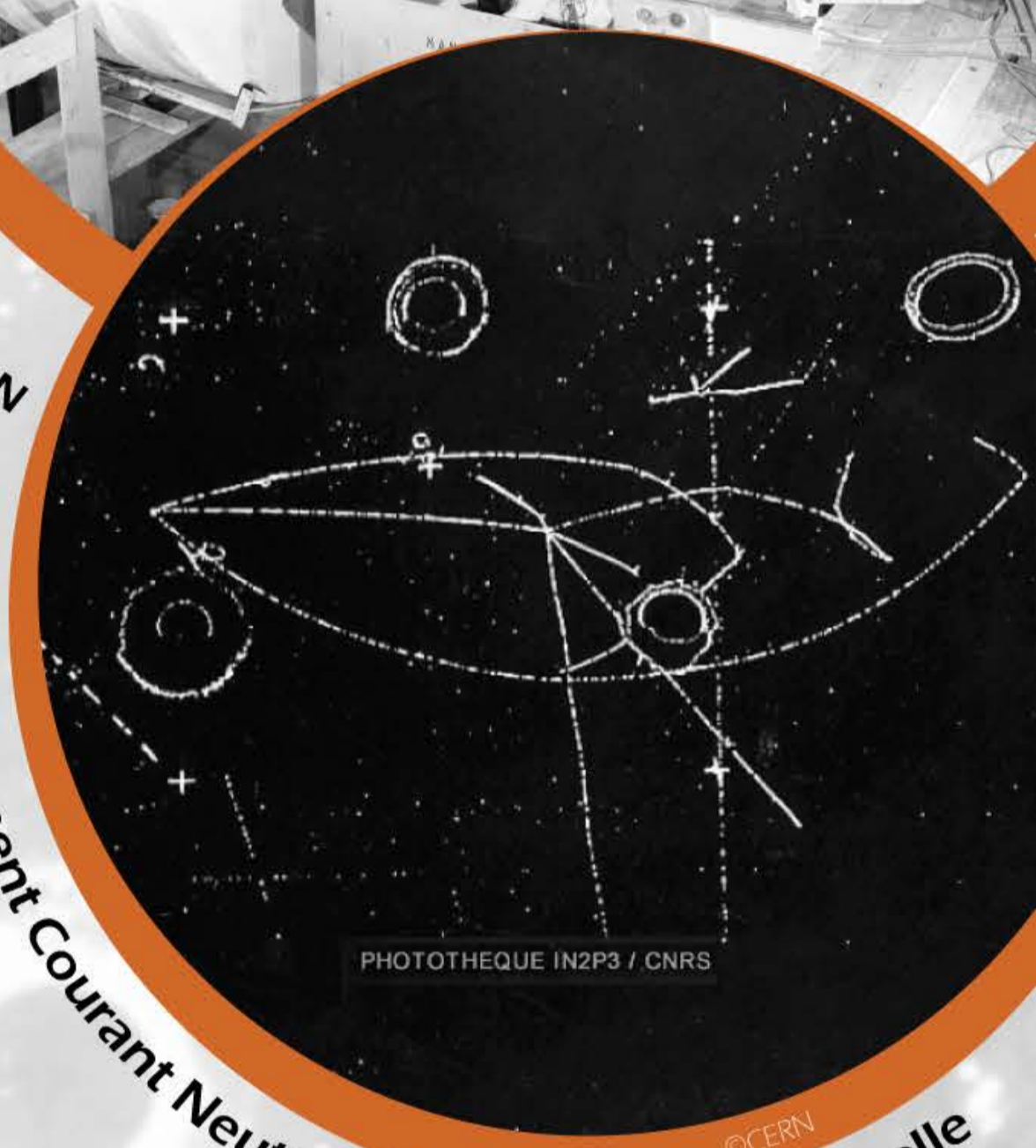
Evènement Courant Neutre observé dans Gargamelle